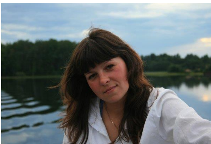
Автор проекта Гурова Е.Г.